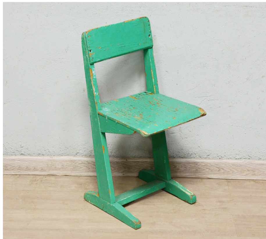
старые и неудобные стулья