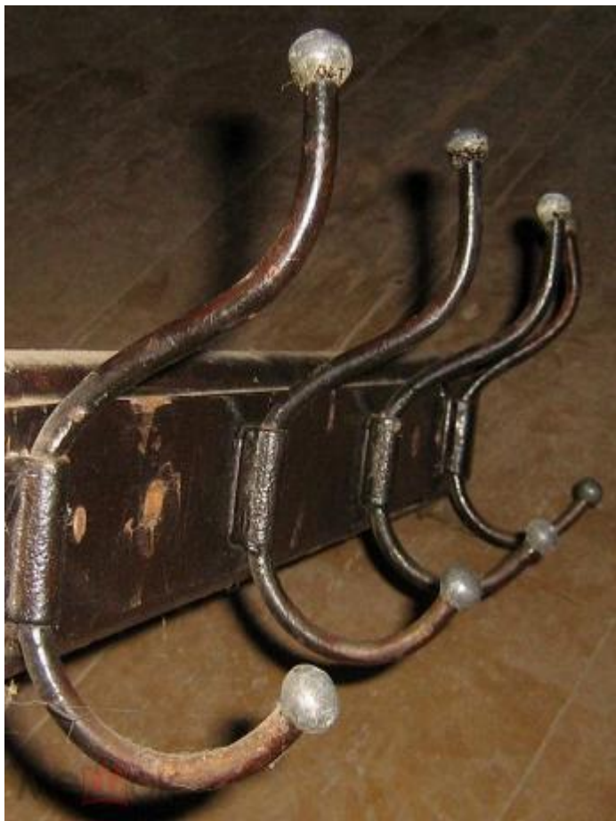
Старые крючки для Одежды